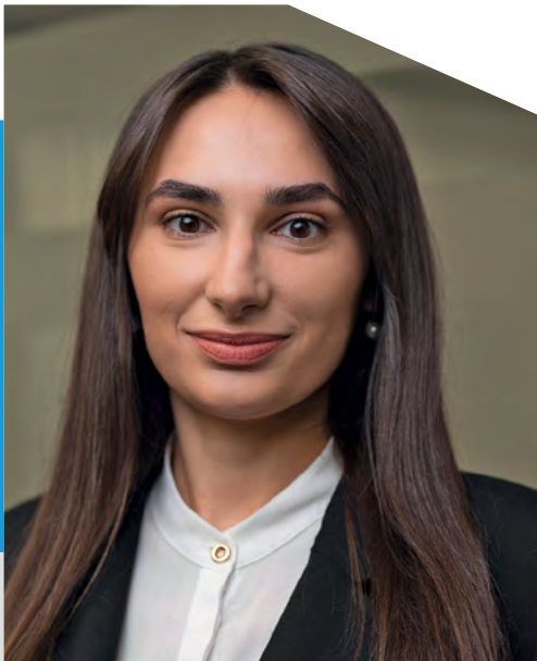
Адвокатка VB PARTNERS

У травні 2022 року в законодавство України введено нову санкцію – стягнення в дохід держави активів осіб, що створили загрозу національній безпеці України або значною мірою сприяли її створенню.