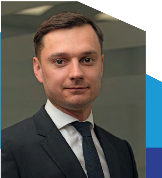
Радник VB PARTNERS

2014 рік. Україна активно реалізує антикорупційну політику та імплементує в національне законодавство міжнародні стандарти. Одним з таких було доповнення Кримінального кодексу статтею 366-1.