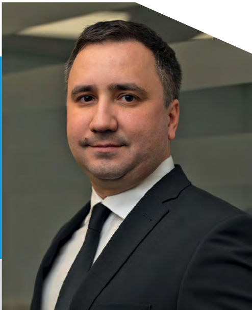
Партнер VB PARTNERS

Одним з найпоширеніших інструментів збору доказів у кримінальному провадженні є тимчасовий доступ до речей та документів.